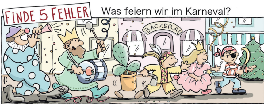
Apfel, Kaktus, Banane, BäckerAI, Weihnachtsbaum

viel verboten: Sie durften kein Fleisch essen (Karneval heißt übersetzt: Fleisch, lebe wohl), keinen Alkohol trinken und nicht feiern. Sechs Wochen lang. Und deshalb wurde vor dem Beginn der Fastenzeit noch einmal richtig gefeiert, gegessen und getrunken. Am Karneval. Da wollte man auch gerne in eine andere Rolle schlüpfen, jemand anderes sein. Und deshalb verkleidete man sich. Zum Beispiel als Bischof oder als König. Im Karneval war das erlaubt. Karneval und Fastenzeit gehören also ganz eng zusammen, doch viele wissen das heute leider nicht mehr. Sie feiern Karneval, doch an die Fastenzeit denken sie nicht. Das ist eigentlich schade.