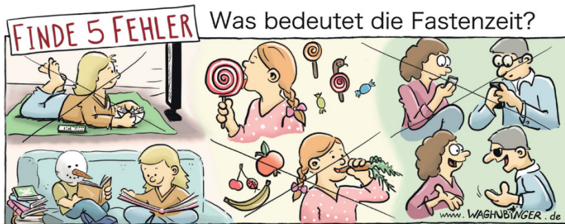
Schneemannkopf, Schnecke, Käfer, falsches Bild durchgestrichen, Augenklappe

Beerdigung: Bei Fragen hinsichtlich der Gestaltung einer Trauerfeier in der Kirche oder auf dem Friedhof wenden Sie sich bitte an Ihre Kirchengemeinde. Für die Terminklärung für eine Trauerfeier und die Beerdigung sprechen Sie bitte zuerst mit einem Beerdigungsinstitut Ihrer Wahl und sprechen dann den möglichen Termin zur weiteren Planung mit uns ab.